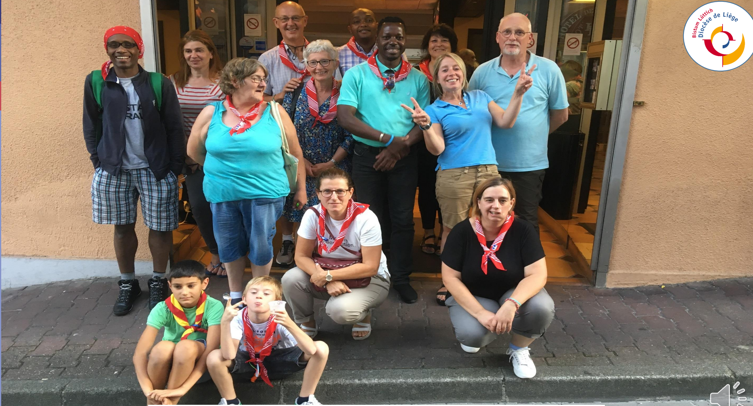
Pèlerinage à Lourdes 2019 – Le groupe Fraternel devant son hotel.