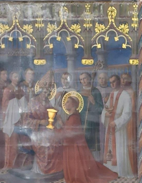
Il quitte l'armée et il se retire auprès de Saint-Maire qui l'ordonne diacre