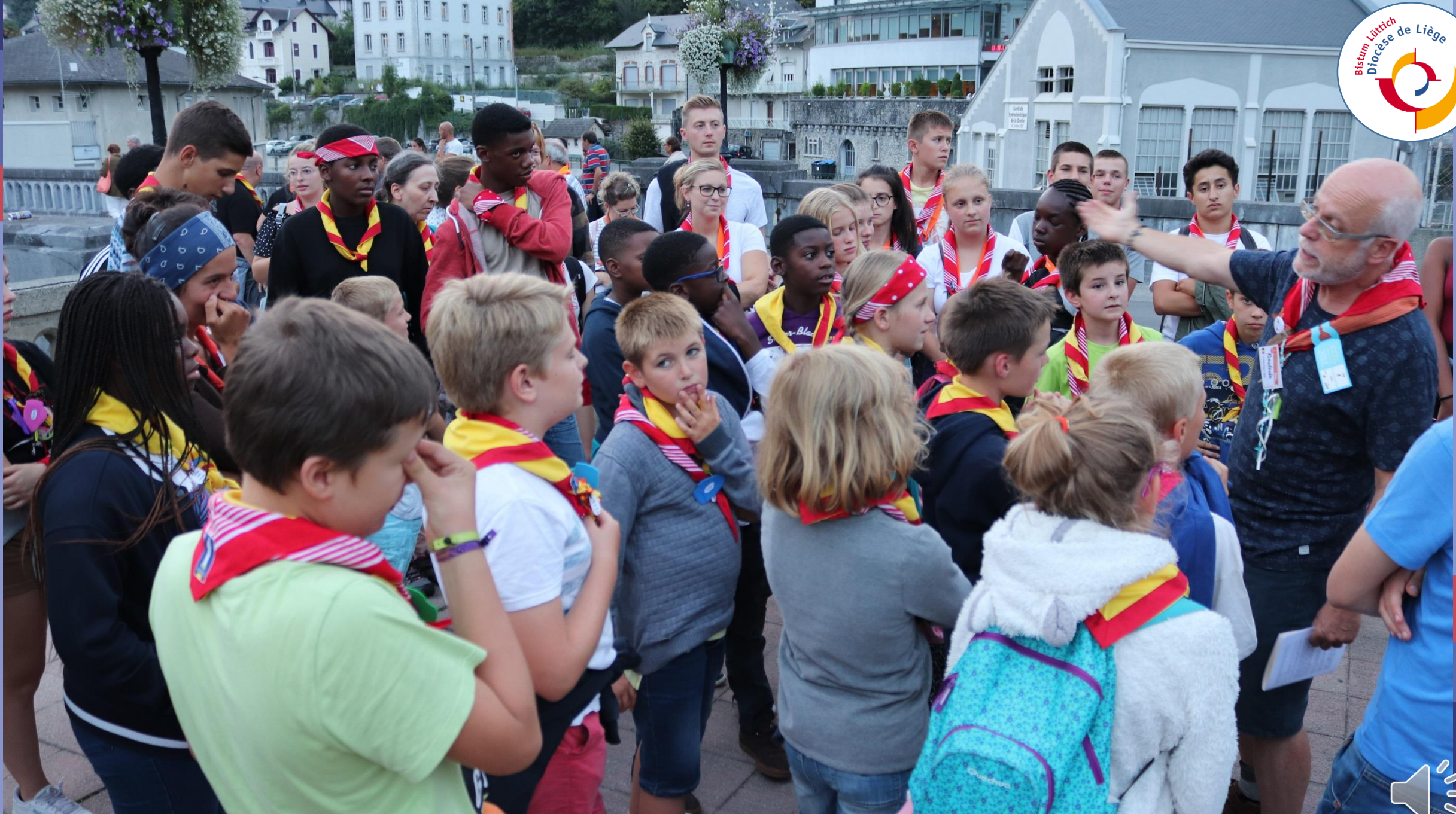
Pèlerinage à Lourdes 2018 – Excursion dans le centre-ville