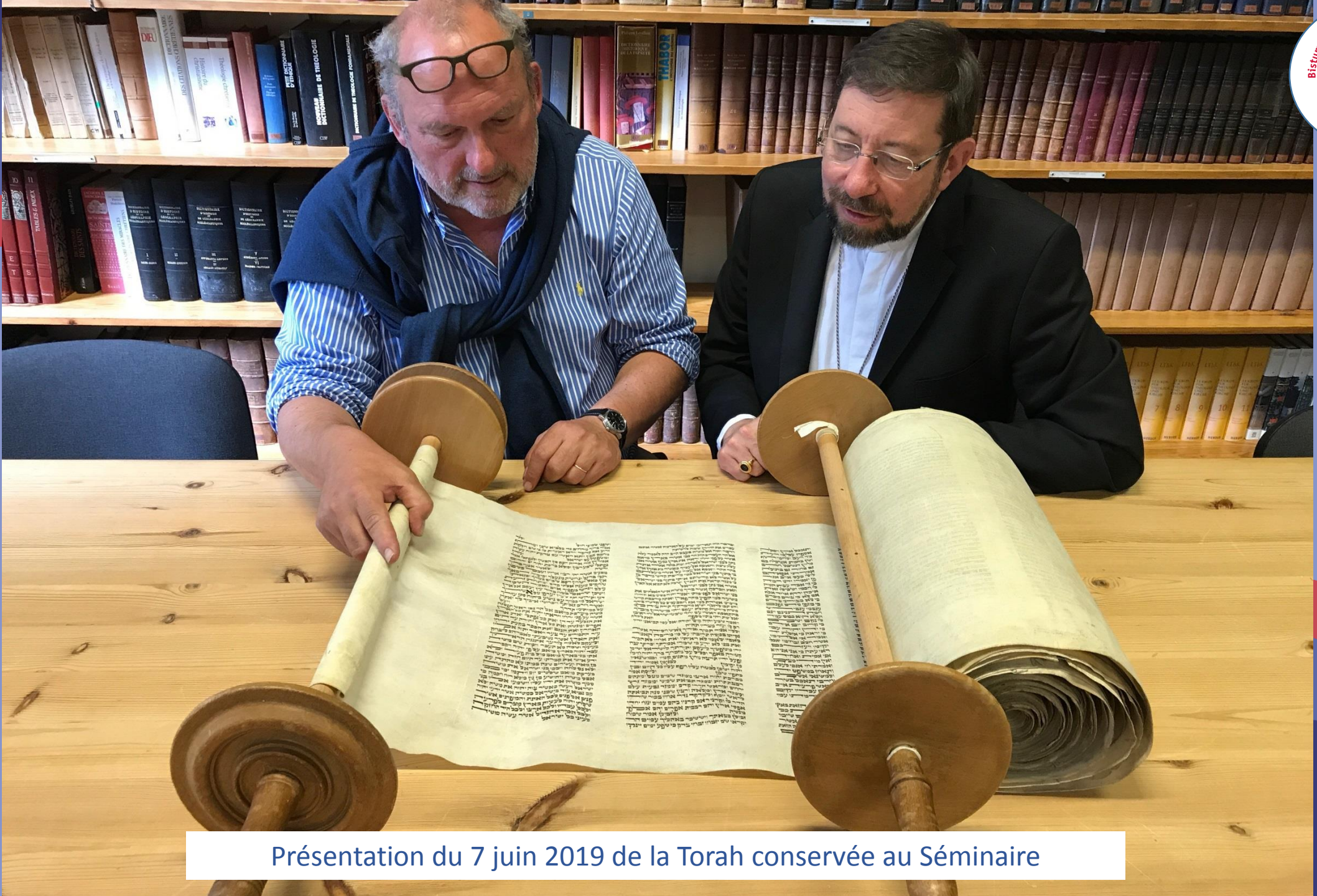
Présentation du 7 juin 2019 de la Torah conservée au Séminaire