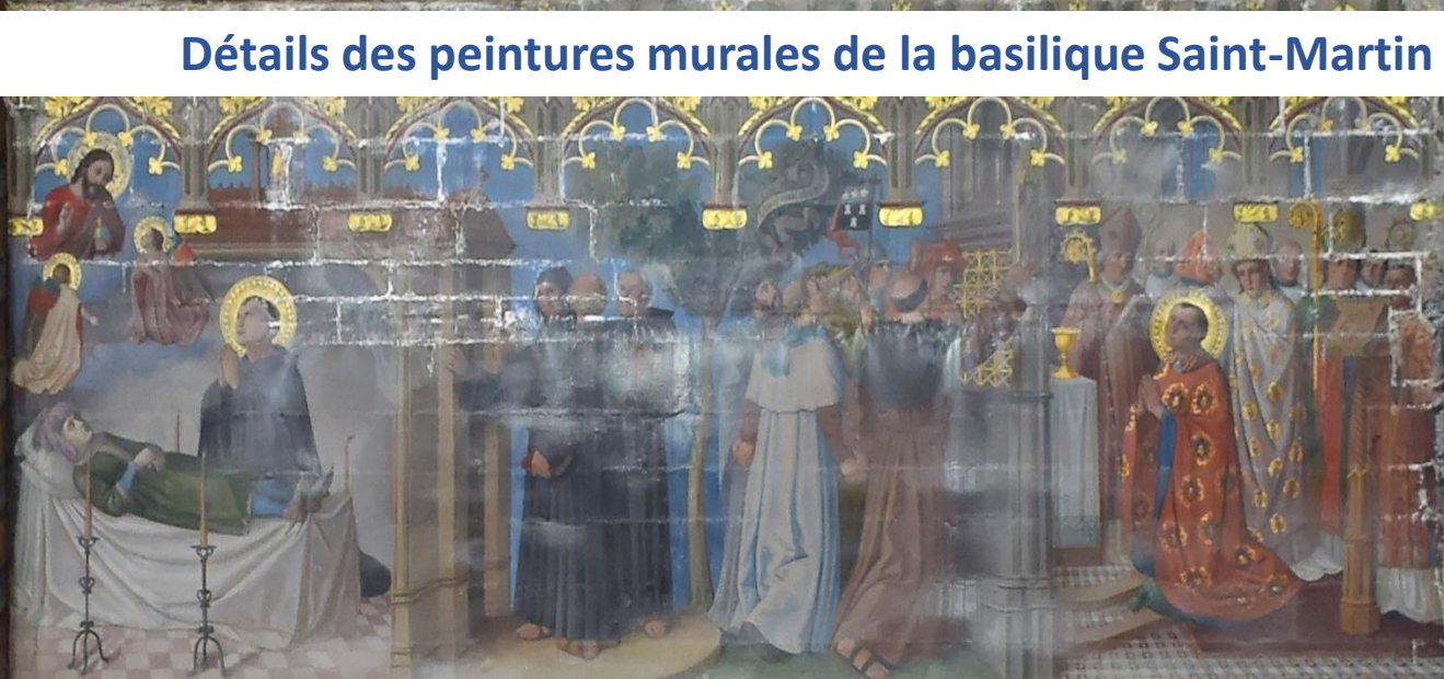
Caténunème ressuscité par les ferventes prières de Saint-Martin qui lui administre le saint-Baptême L'an 371 saint-Martin redant aux instances des habitants de la Touraine est sacré évêque de Tours