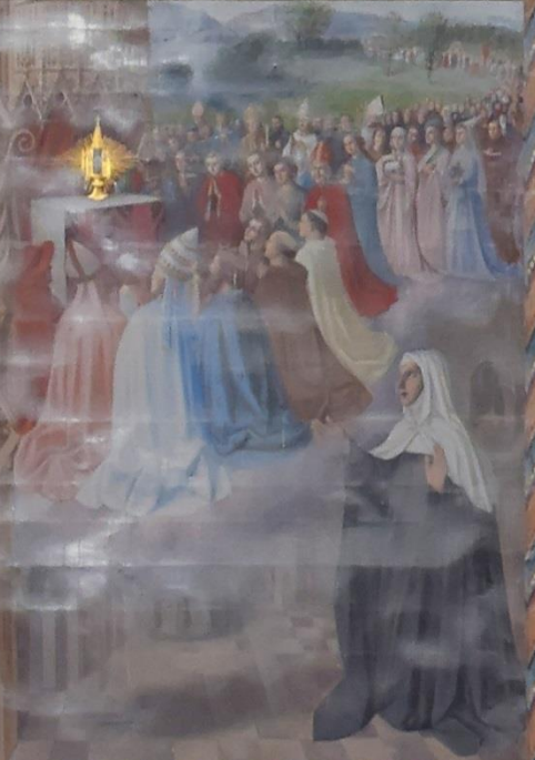
Vision d'Isabelle de Huy en adoration dans la collégiale de Saint-Martin