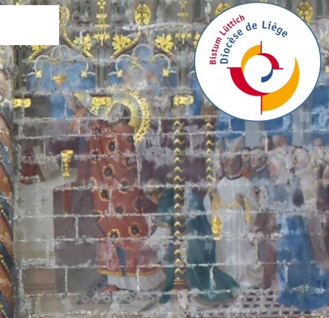
La fête de saint-Martin est entourée d'une vive lumière pendant qu'il célèbre le saint-sacrifice de la messe